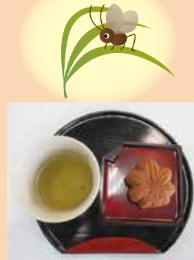
おやつはもみじ饅頭