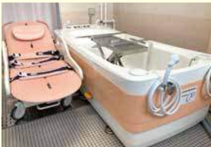
マリンコートRemo(ストレッチャー型浴槽) ストレッチャーに寝た状態のまま入浴できます。