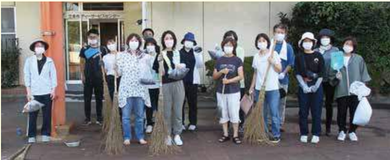
ゴミ拾いを終えて集合写真

ボランティア委員会では職員のボランティア活動としてペットボトルのキャップや使用済み切手集めを行い、アジアやアフリカの保健医療協力を行っています。8月にはゴミ拾いボランティアを募って施設周辺の美化活動を行いました。