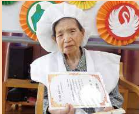
元気で長生きしてください