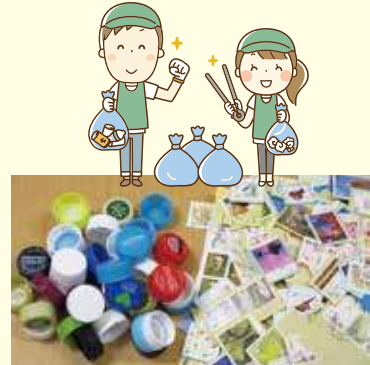
ペットボトルキャップと使用済み切手を集めています