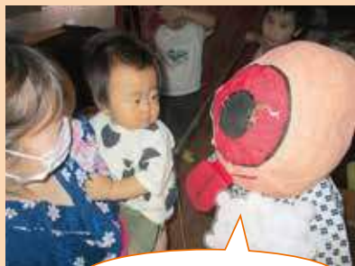
ひとつ目小僧だぞ〜！