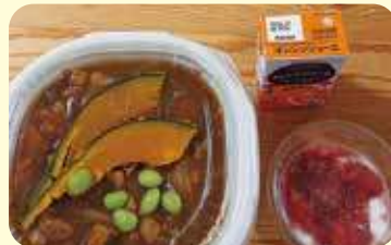
オレンジジュース 80本