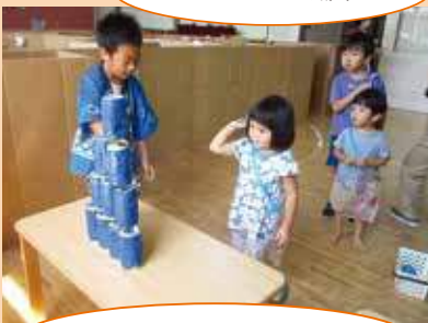
「いらっしやいませ〜！」