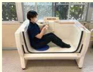
アビット(ソファ型浴槽) ソファに座る感覚で浴槽をまたぐことなく入浴できます。

浴槽に腰掛け、体を90度旋回し入浴姿勢をとります。扉を閉めてお湯を溜めたら入浴開始です。