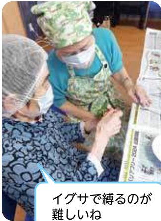
イグサで縛るのが難しいね