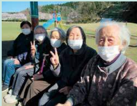
春の風を感じながら、お花見日和でした♡

5月1日より異動となりました。 皆様にたくさん楽しんでいただ けるよう頑張ってます。