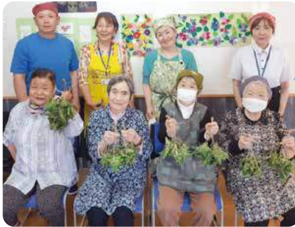
最後は集合写真♪ ハイ・チーズ★