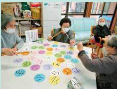
カルタ釣り!!皆で探して大はしゃぎです★

天気の良い日に、トリムの森でのお花見や、藤の花を見に保内公園へのドライブを楽しんできました。 新しいレクリエーションのテーブルゲームでも皆さん白熱していました。