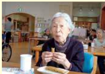
三条祭りに、職員お手製のポッポ焼きを美味しく頂きました。